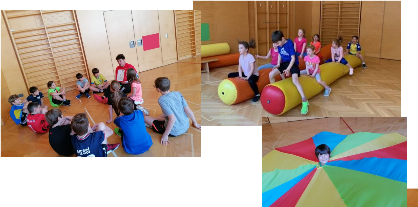
8.2.2024: Faschingsfeier mit der „Magischen Eva“